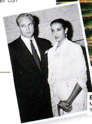
ESTILO HINDÚ MARLON BRANDO Y ANNA KASHFI.