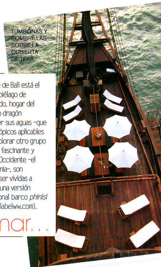
TUMBONAS Y SOMBRILLAS SOBRE LA CUBIERTA DE TEKA.

A l este de Bali está el archipiélago de Komodo, hogar del mítico dragón homónimo. Recorrer sus aguas —que reúnen todos los tópicos aplicables a un paraíso— o explorar otro grupo de islas igualmente fascinante y desconocido para Occidente —el de Mergui en Birmania—, son experiencias para ser vividas a bordo del Sitolona; una versión deluxe del tradicional barco phinisi indonesio ( privatelabelww.com ).