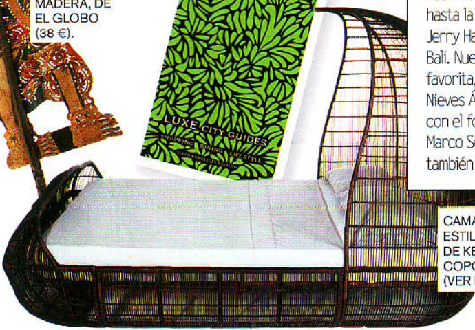
CAMA VOYAGE ESTILO BALI, DE KENNETH COPONPUE (VER PREGIO).

PURA MAGIA LA TOP SE CASÓ EN EL HOTEL BEGAWAN GIRI (COMO.BZ).