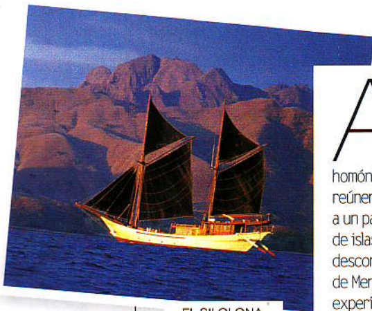
EL SILOLONA, ANCLADO JUNTO A LAS COSTAS DE KOMODO.

medida —y en 24 horas—, o que miembros de la plantilla contacten con reputados anticuarios de la región para un pequeño shopping . El broche de oro lo pone el festín nocturno en la impresionante casa de reuniones, «una réplica de las que hay en Sumatra, incluido su techado en forma de cornamenta, alojada entre arrozales milenarios cuyas plantas alcanzan la altura humana». Un viaje, en suma, hacia esa armonía primitiva que los Hardy han sabido recuperar para sus huéspedes. ■ Leticia Echávarri